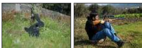
Torneio na região Centro, Fev.º de 2005