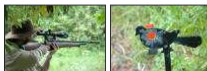
Torneio na região Sul, Maio de 2005

O Clube de Tiro de Campo convida-o desde já a conhecer esta modalidade e os seus praticantes e actividades, através do respectivo site e fórum de discussão, a que poderá aceder através do site www.fieldtargetportugal.com